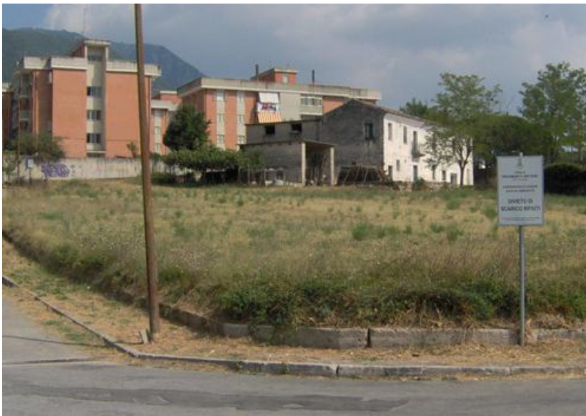
Piedimonte Matese - Loc. Sepicciano – mq 3775